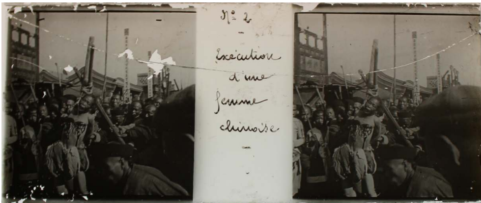
Anonyme, Exécution d'une femme chinoise , Chine, début du xx e siècle. Positif monochrome sur plaque de verre au chloro-bromure d'argent, 6 x 13 cm.

© Auteur inconnu/ECPAD/Fonds privés – pièces non cotées, plaque n° 2.