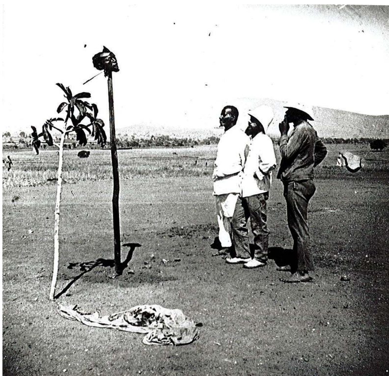
Sans titre [Une exécution], Madagascar, 1900-1902. Positif monochrome sur plaque de verre au chloro-bromure d'argent, 6 x 13 cm.